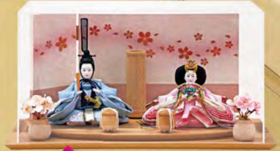
間口65cm×奥行40cm×高さ41cm ご予価 195,000円