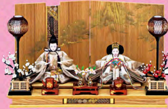
松寿雛 親王飾り (ヘルベット刺しゅう)