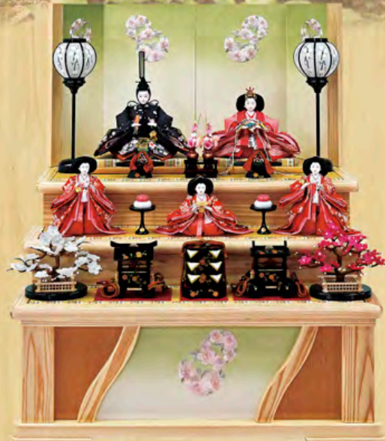
華宝雛 天竜杉 収納型飾り