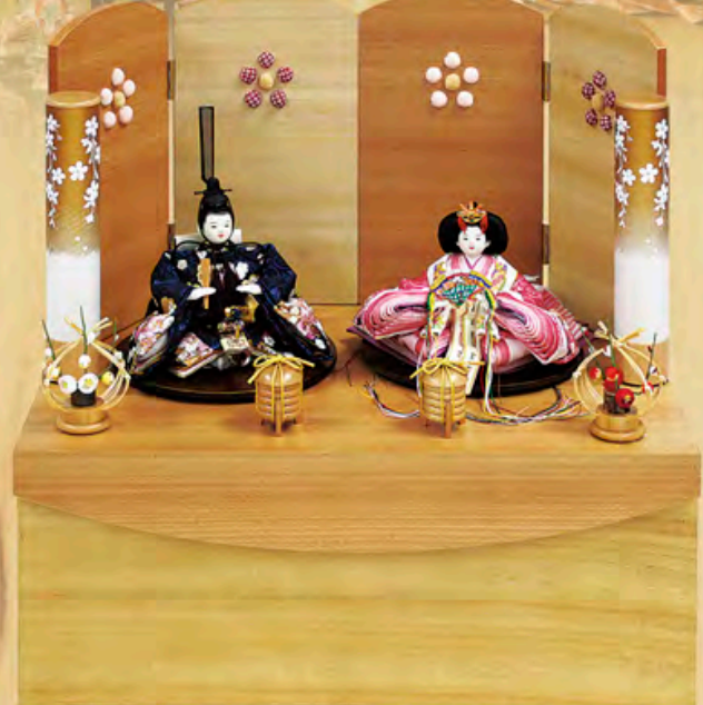
華祥雛 収納型飾り