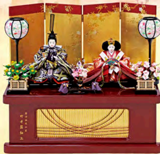
間口55cm×奥行35cm×高さ48cm ご奉仕価格 158,000円