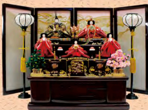
間口160cm×奥行105cm×高さ105cm 価格 295,000円