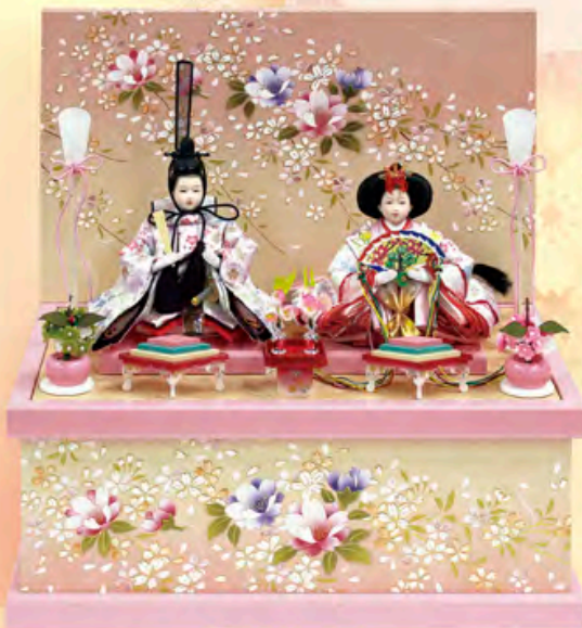
間口40cm×奥行20cm×高さ36cm ご奉仕価格 105,000円