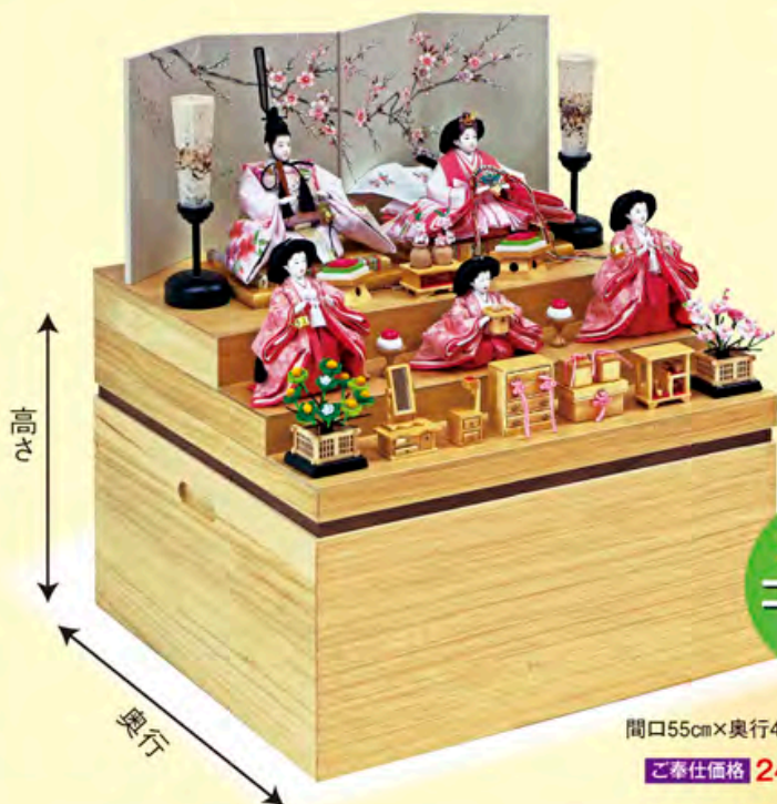
間口55cm×奥行49cm×高さ61cm ご予仕価格 245,000円