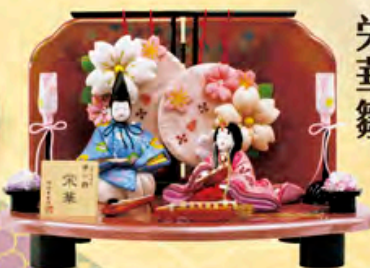
間口41cm×奥行31cm×高さ28cm ご予仕価格 店内表示