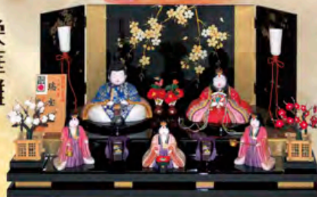
間口70cm×奥行36cm×高さ37.5cm ご予仕価格 265,000円