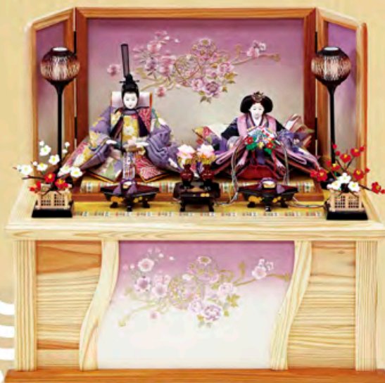
加賀友禪 寿雛 天竜杉 収納型飾り