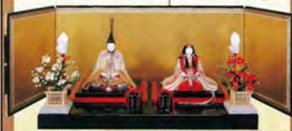
幸一光ならではの独特の風合いで他に類を見ない作品です。

抑えた色調と 独自のな形 愛らしさの中にも、 日本古来の美を 表現しようとする制作を 続けておられます。