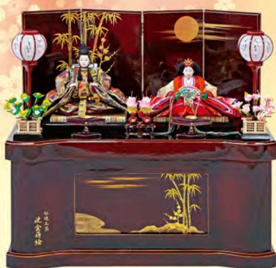
間口70cm×奥行40cm×高さ63cm ご奉仕価格 258,000円