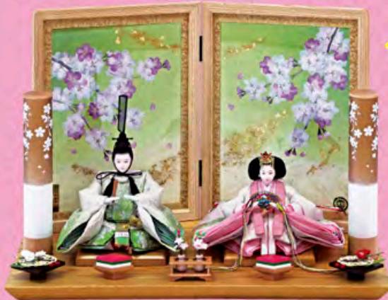
花舞雛 押花親王飾り (金彩刺しゅう)