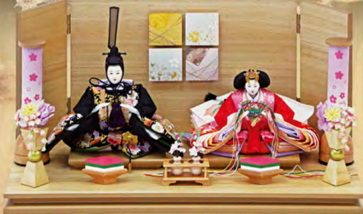
綾奈雛 木目親王飾り