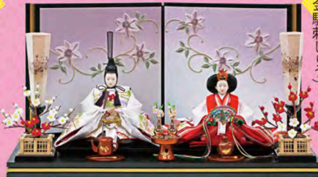
福寿雛 親王飾り (金駒刺しゅう)