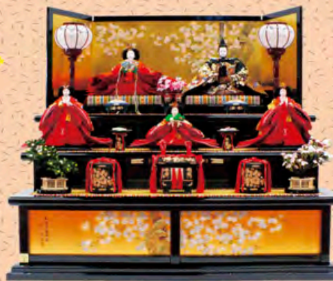
間口120cm×奥行110cm×高さ110cm 価格 585,000円