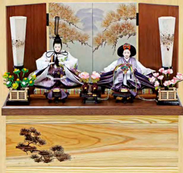
松雲雛 木目収納飾り