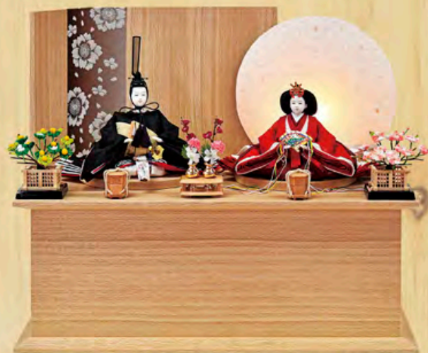
まどか雛 収納型飾り