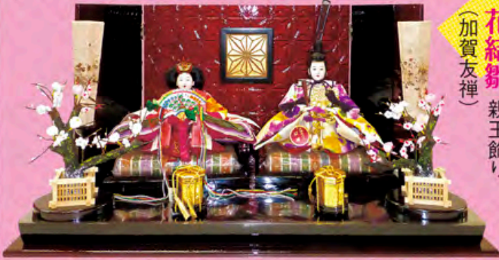
花結雛 親王飾り (加賀友禅)