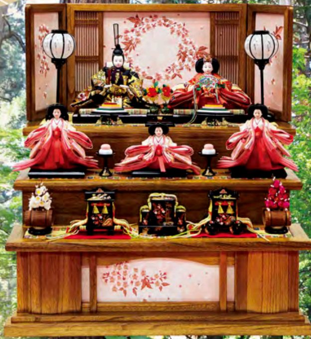
王朝雛 桐宇造三段飾り