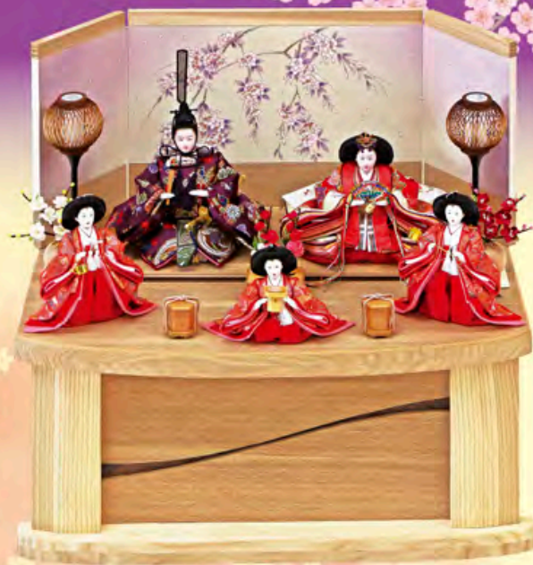
間口60cm×奥行42cm×高さ54cm ご予仕価格 225,000円