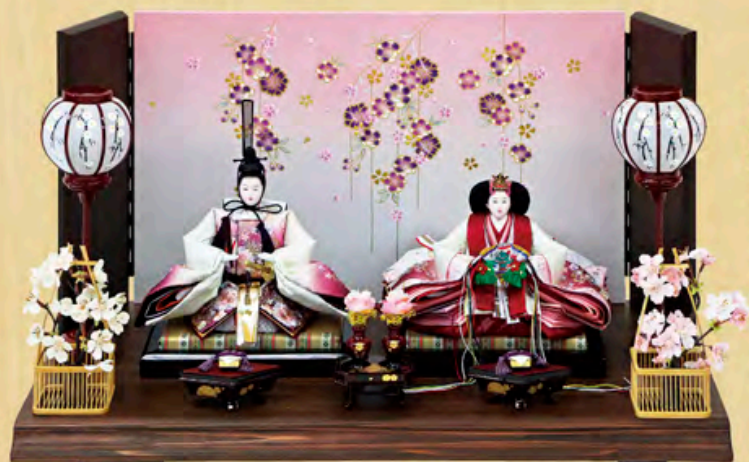
八重雛 天竜杉親王飾り