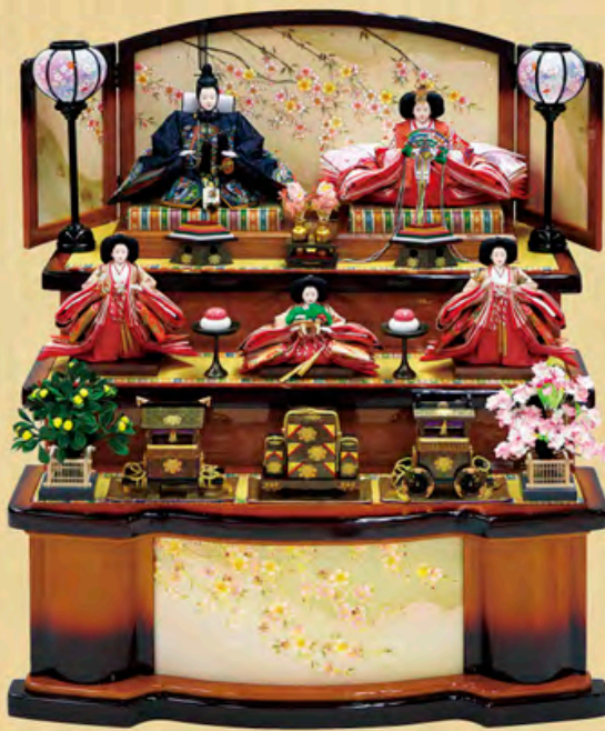
舞華雛 桐木自家具調三段飾り