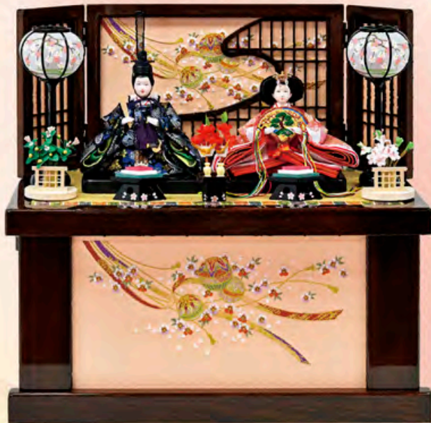
間口55cm×奥行32cm×高さ52cm ご奉仕価格 88,500円