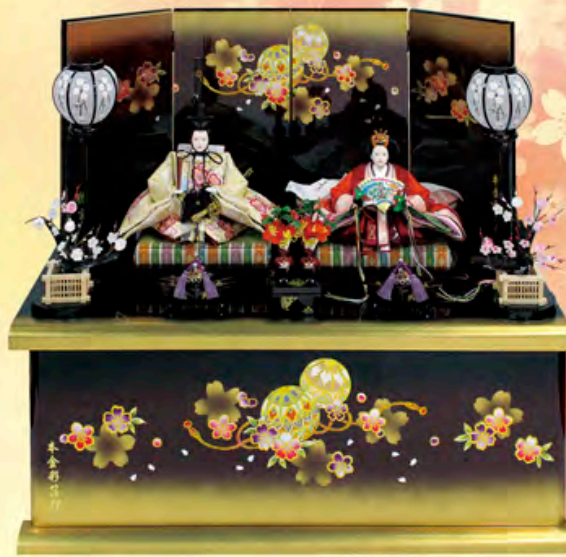
間口75cm×奥行43cm×高さ66cm ご奉仕価格 195,000円