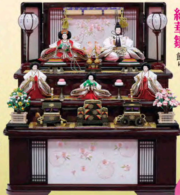
間口69cm×奥行69cm×高さ74cm ご奉仕価格 273,000円