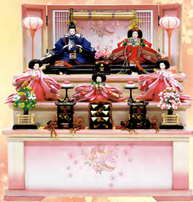
間口69cm×奥行69cm×高さ74cm ご予仕価格 255,000円