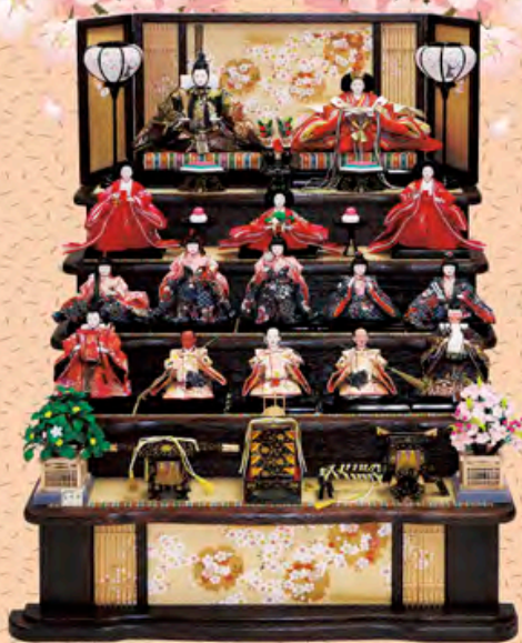
間口90cm×奥行103cm×高さ112cm 価格 355,000円

※人形、道具はお好みにより自由に組み替えができます。 ※組み合わせ内容により価格は変動します。 ※人形収納用桐箱付き。