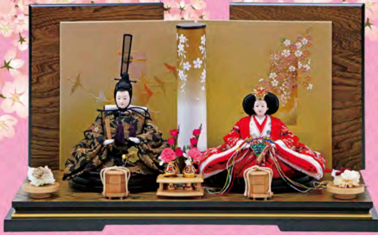
鶴舞雛 親王飾り (正絹コブラン)