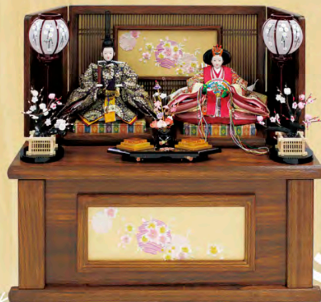
正絹コブラン織 千草雛 収納型飾り