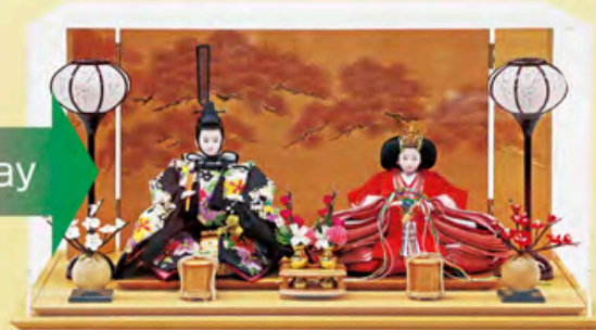
錦松 間口60cm×奥行40cm×高さ31cm ご予価 185,000円