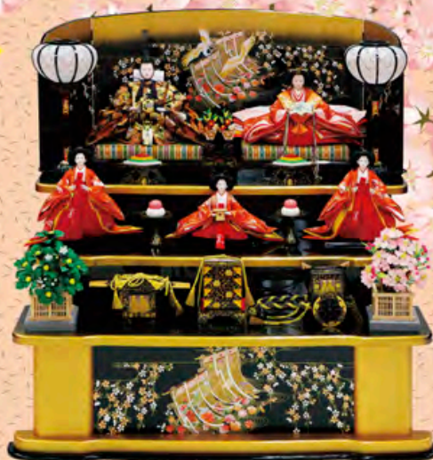
間口107cm×奥行85cm×高さ101cm 価格 225,000円