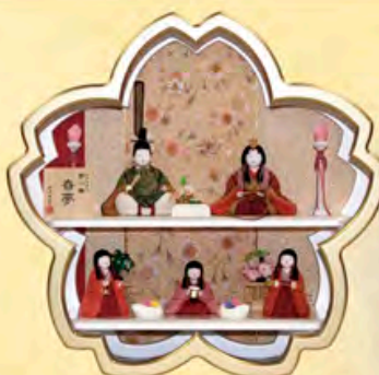
間口45cm×奥行20.5cm×高さ43cm ご予仕価格 125,000円