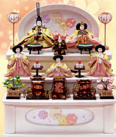
間口50cm×奥行44cm×高さ55cm ご予仕価格 145,000円